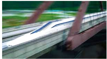
図1: 発熱ゼロの超伝導。