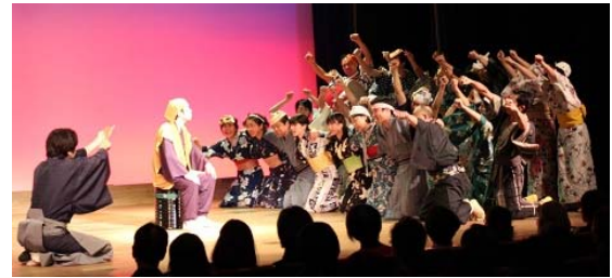
昨年の公演の様子